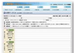
<目標設定入力画面>