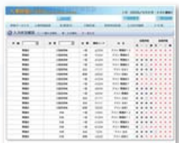
<入力状況確認画面>