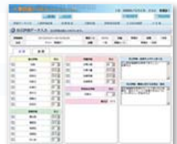
<自己評価入力画面>